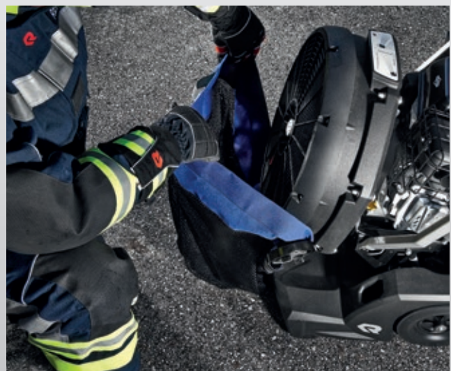
Schaumnetz an der Ventilatoreinheit montieren.

Mithilfe des Schaumnetzes kann der Lüfter sogar Leichtschaum produzieren. Das Netz bei den V- und E-Modellen ist in einem kleinen Fach direkt unten am Gehäuse des Lüfters untergebracht und kann so immer mitgeführt werden. Es wird einfach über die Ventilatoreinheit gezogen und mit einem Handgriff fixiert. Unter Verwendung eines üblichen Z2 Zumischers kann dann zusätzlich Leichtschaum produziert werden. Der Leichtschaum kann etwa zur Brandbekämpfung per Schlauchlutte in Kellerbereiche oder unterirdische Anlagen eingebracht werden. Alternativ kann der Lüfter auch auf Drehleitern zur Beschäumung von Hallendächern oder Brandherden von oben eingesetzt werden.