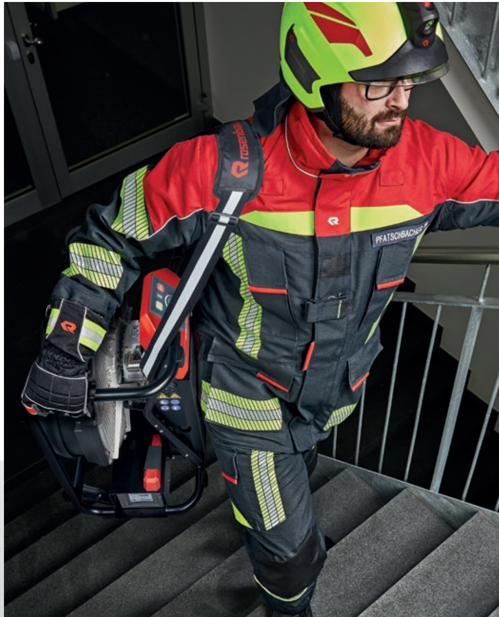
Mit dem Tragegurt kann der RTE AX B16 sicher über Treppen transportiert werden.