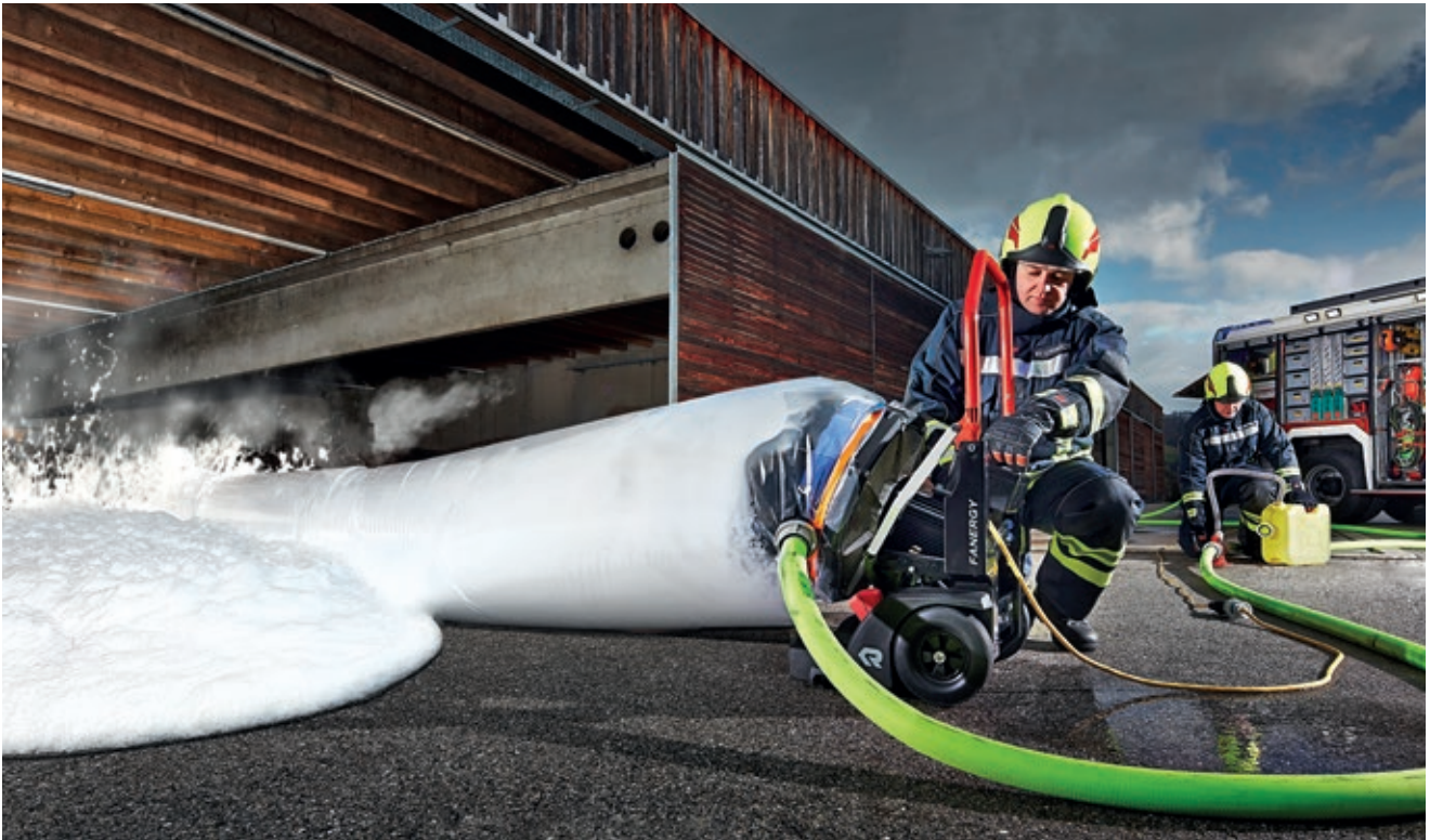
Mit Schlauchlutte, um Schaum in Keller und unterirdischen Anlagen einzubringen.