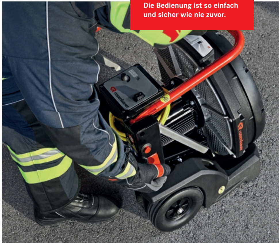
Mit einem Handgriff können die E- und V-Modelle in Erstangriffsstellung (+20°) gebracht werden.

Die Bedienung ist so einfach und sicher wie nie zuvor.