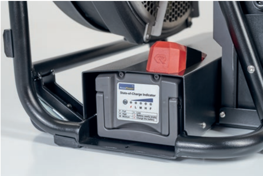
Ein erprobter Hochleistungsakku sorgt für lange Laufzeit.