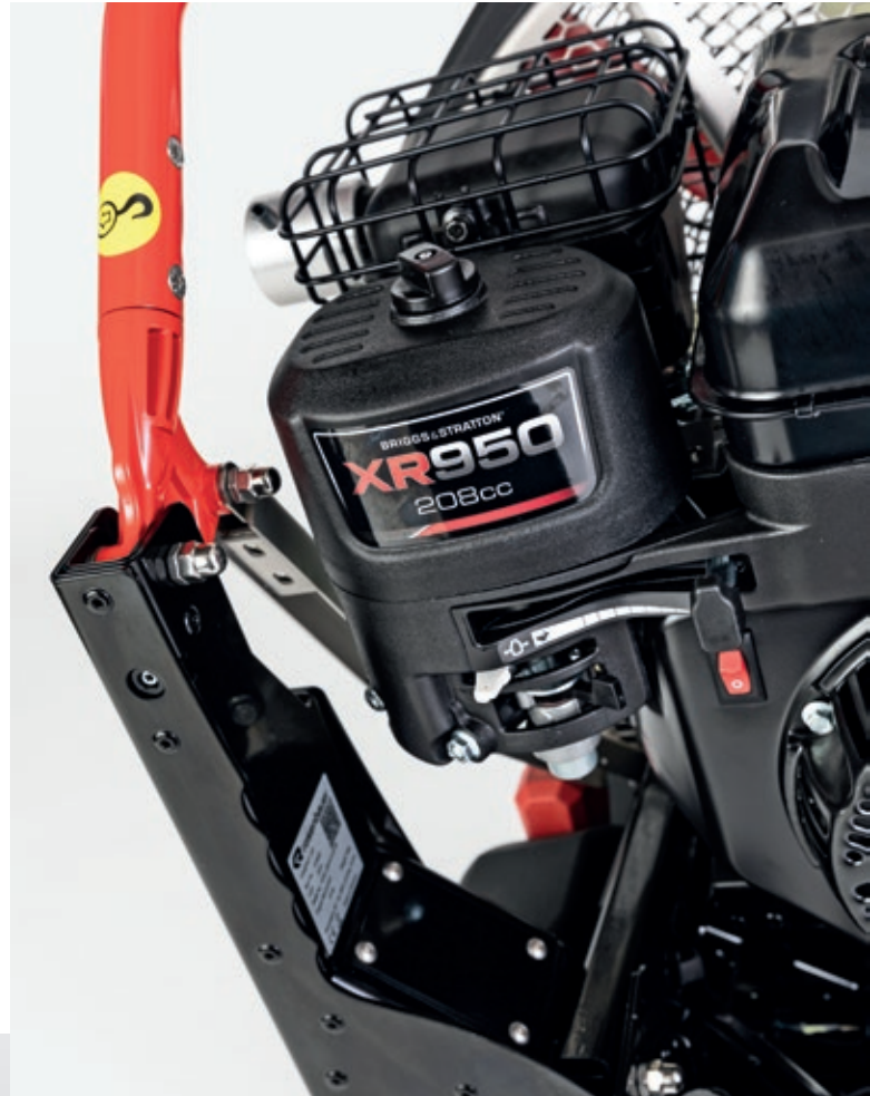
FANERGY V22 mit Briggs & Stratton Motor