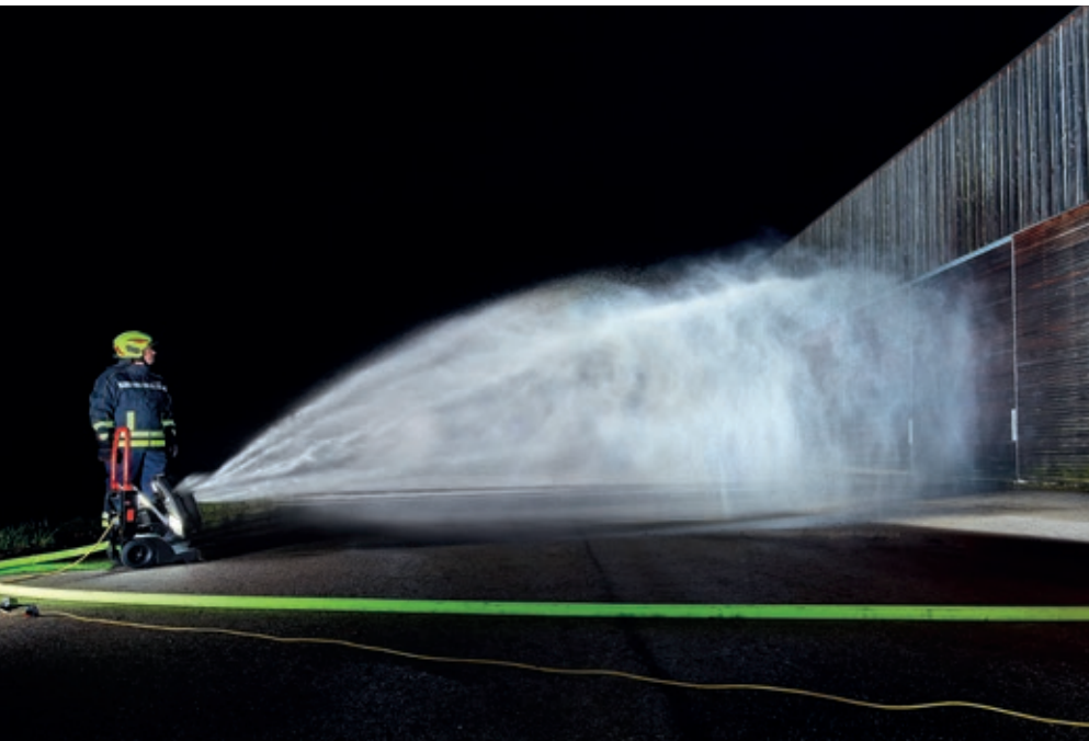
Wurfweiten bis zu 20 m sind möglich.

Durch die zentrale Platzierung der Wassernebeleinheit in der Mitte der Düse kann der Wassernebel mit hoher Luftleistung ausgebracht werden. Mit den Hochleistungslüftern kann eine Wurfweite bis zu 20 m erzielt werden. Bei rund 5 bar Druck liegt die Durchflussmenge bei ca. 200 l/min. Das Handling funktioniert denkbar schnell und einfach: ohne extra Zubehör, ohne Übergangsstück und mit den gängigen Gerätschaften der Feuerwehr. Per Storz C-Anschlusskupplung wird der Feuerwehrschauch direkt am Gerät angeschlossen, der Lüfter mit Wasser versorgt und so der Wassernebel ausgebracht.